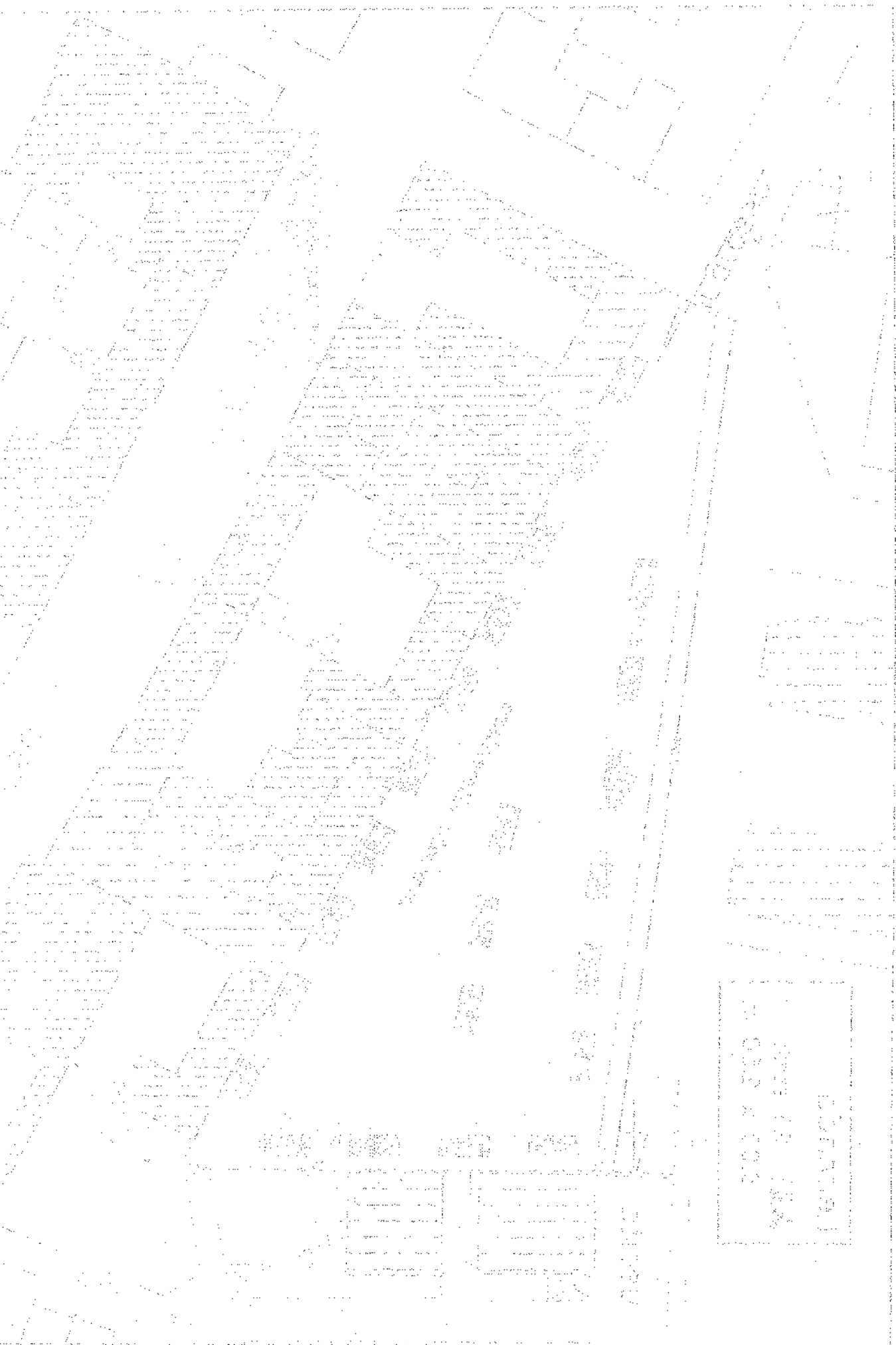
CHARTER UNIVERSITY ENGINEERING DEPARTMENT MECHANICAL ENGINEERING DEPARTMENT